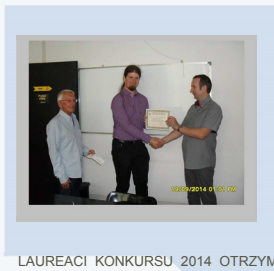
LAUREACI KONKURSU 2014 OTRZYMUJĄ NAGRODY OD PRZEDSTAWICIELI FUNDACJI