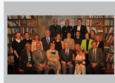
ZARZĄD I SYMPATYCY FUNDACJI - 2014